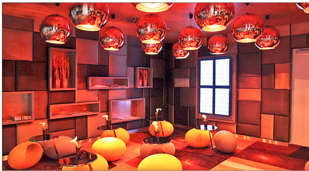
Modern und chic: Das „Novotel München Airport“ am Flughafen der bayerischen Landeshauptstadt ist komfortabel eingerichtet – zwei Wochenbericht-Gewinner dürfen das neue Hotel testen.

Wer mitmachen will, muss nur den Coupon auf Seite 20 richtig ausgefüllt an uns schicken. Das Los entscheidet!